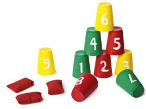
スローイングゲーム 700円