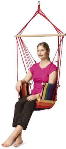
ハンモックチェア 2000円