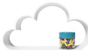
クラウド型シェルフ (大小二つセット) 1セット700円