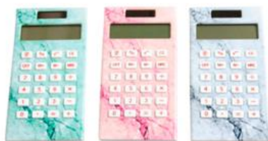
大理石柄電卓 各400円