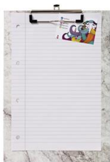
大理石柄クリップボード 300円