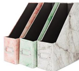
大理石柄マガジンホルダー 各300円