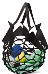
フェルト生地ネットバッグ 200円